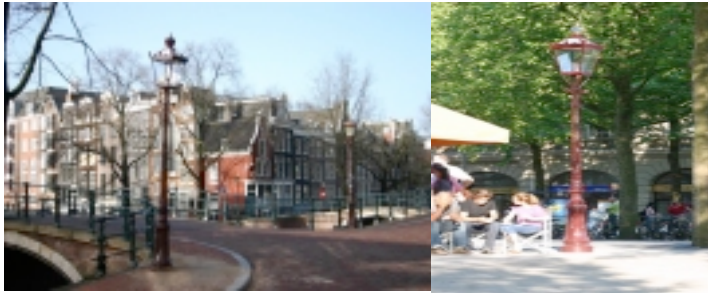
De nieuwe kroonlantaarn op de hoek van de Reguliersgracht en Prinsengracht met op de achtergrond een oude Ritterlantaarn (links) en een nieuwe kroonlantaarn met gekleurde kroon op het Leidseplein (rechts).

en Vervoer in de bestek- en aanbestedingsfase en ik adviseer de stadsdeelraad vanaf de begroting 2008 geld in het parkeerfonds te reserveren om vanaf dat jaar de nieuwe lantaarns te kunnen plaatsen. Verder uitstel is ook nauwelijks verantwoord omdat de oude lantaarns praktisch uit elkaar vallen van ellende.