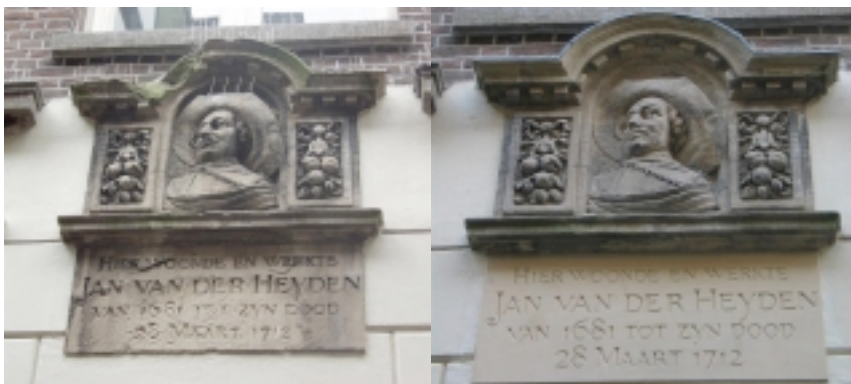
De gevelsteen van Jan van der Heyden (1637-1712, schilder en uitvinder van de straatlantaarn en de brandspuit) in de Koestraat vlak bij de Nieuwmarkt, links de situatie voor restauratie en rechts daarna. De steen werd op 28 maart 1912 onthuld

De Vereniging van Vrienden van Amsterdamse Gevelstenen zorgt al sinds 1991 voor het onderhoud en het herplaatsen van gevelstenen, met name in de binnenstad van Amsterdam. Op talloze plaatsen herinnert de gevelsteen aan de persoon of een ambacht die aan een bepaald pand is verbonden. Toen er nog geen huisnummers waren konden hiermee de huizen beter van elkaar worden onderscheiden en tegenwoordig zijn ze vooral een lust voor het oog voor de Amsterdammers en de toeristen uit binnen- en buitenland. Voor elke restauratie vindt er gedegen onderzoek plaats om de stenen historisch gezien zo verantwoord mogelijk te restaureren. Het terugbrengen van de authentieke kleurstelling vormt hierbij een belangrijk onderdeel.