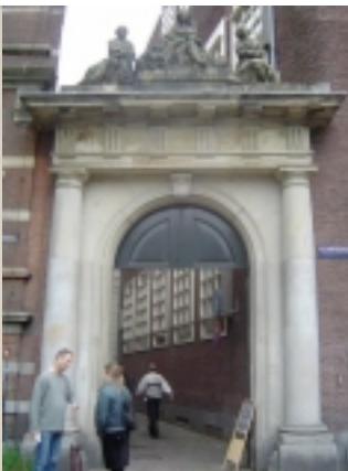
Het poortje dat toegang geeft tot het Oudemanhuispoortcomplex aan de Kloveniersburgwal, vroeger en nu.

De vierde poort betreft de Spinhuispoort in de Spinhuissteeg uit 1645. In het Spinhuis werkten onder andere bedelaressen en prostituees. In 1782 verhuisde de instelling naar het Nieuwe Werkhuis aan de tegenwoordige Roetersstraat. Men nam toen ook het reliëf van het poortje met een aan Hendrick de Keyser toegeschreven beeldhouwwerk mee. Het reliëf stelt de