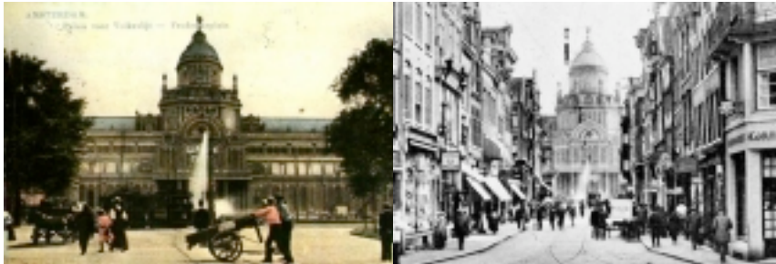
Het Paleis voor Volksvlucht op het Frederiksplein (links) en vanuit de Utrechtsestraat (rechts), einde van de 19 de eeuw.

De afgelopen periode heeft de Amsterdammer Wim T. Schippers het initiatief genomen om het paleis voor Volksvlucht op het Frederiksplein te herbouwen. Op zich een nobel streven om het stadsgezicht te herstellen, met name vanuit de prachtige Utrechtsestraat. De Nederlandse Bank kan op deze locatie bepaald geen parel van de Amsterdamse binnenstad worden genoemd. De Nederlandse Bank heeft desgevraagd aangegeven wel aan de herbouw te willen meewerken indien zij een vergelijkbaar gebouw elders in de stad, bijvoorbeeld aan de Zuidas aangeboden zouden krijgen. Globaal kost de herbouw van het Paleis, inclusief de sloop van De Nederlandse Bank en vervangende nieuwbouw ongeveer 1 miljard euro. Daarbij rijst dan nog de vraag of het nieuwe Paleis ooit rendabel geëxploiteerd zou kunnen worden, in verband met het geringe aantal efficiënte vierkante meters. In het oude Paleis was dit ook al een probleem.